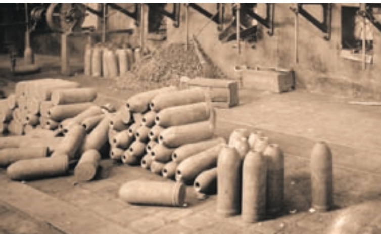
Foto ehemaliger Aktivitäten, hier Delaborierung von Granaten

Ende des 19. Anfang des 20. Jahrhunderts produzierte die Carbonit AG im Gebiet der heutigen Waldsiedlung vorwiegend Sprengstoffe.