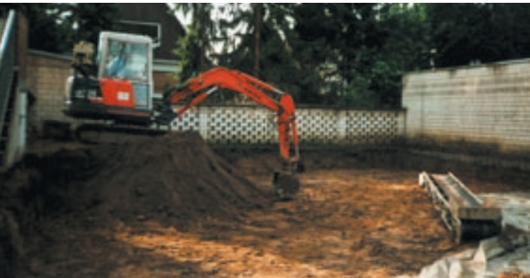
Belasteter Oberboden wird bis zu 1 m abgetragen.