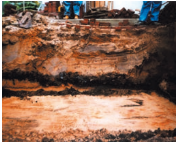
Aschen-/Schlackenhorizont im Bereich des ehemaligen Brandplatzes

Finanziert wurde das Projekt überwiegend aus Landesmitteln (80%) und mit städtischen Mitteln (20%).