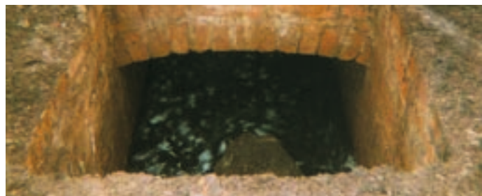
Alter Abwasserkanal der ehemaligen Carbonit AG

Markant ist zum Beispiel die Direktoren-Villa der ehemaligen Carbonit AG Ecke Saar-/Mühlheimer Straße. Heute befindet sich das Dom-Brauhaus in dem Gebäude. Auch Reste der ehemaligen Fabrikanlagen sind in manchen Gärten noch zu finden.