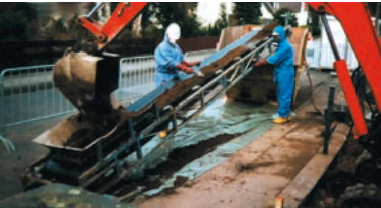
Makroskopisch sichtbare TNT-Stücke werden über Förderbänder separiert