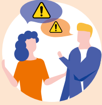
Aile ve Arkadaşlar, Komşuluk